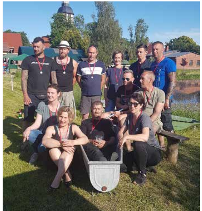
Der Heimatverein Wismar – Hansfelde e.V. sowie der Ortsbeirat bedanken sich bei allen Sponsoren und fleißigen Helfern, denn ohne diese wäre dieses Fest gar nicht möglich gewesen. Eine Fortsetzung des Festes im nächsten Jahr wird es auf jeden Fall geben.