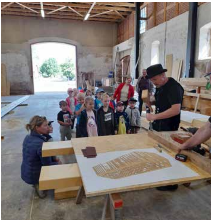
Besuch der Zimmerei Masch.