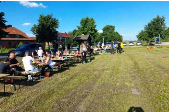
Es gab Bratwurst vom Grill.