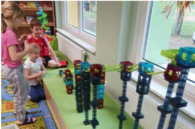
Die neue Murbelbahn