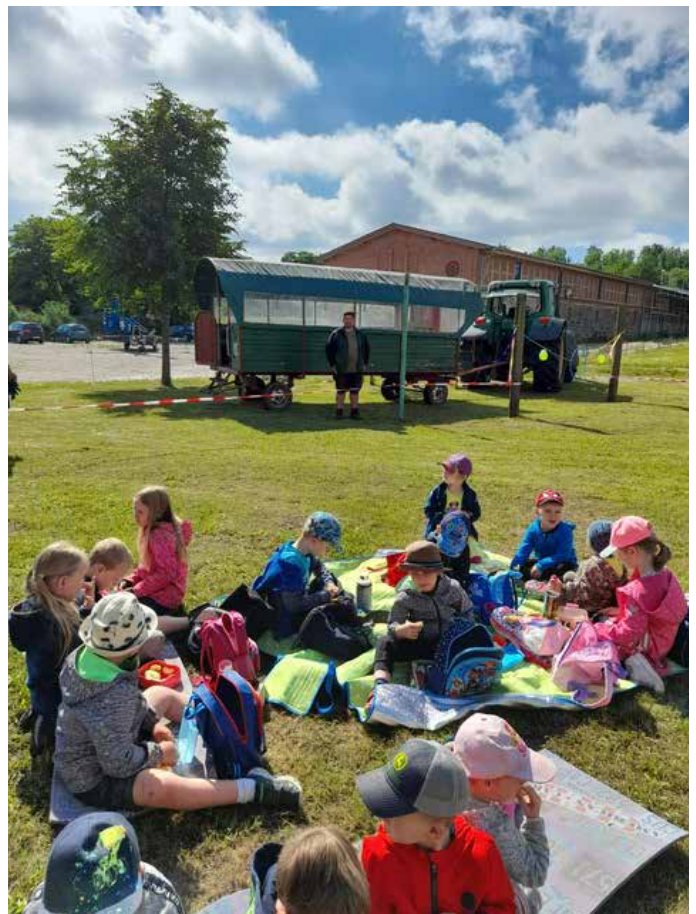
Kremserfahrt mit Luke's Papa bis Lindhorst und anschließend Picknick.