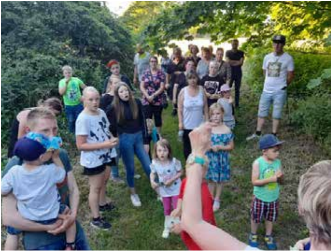
Wanderung durch den Park mit Aufgaben.