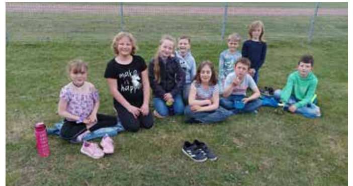
"Wir machen es uns gemütlich"