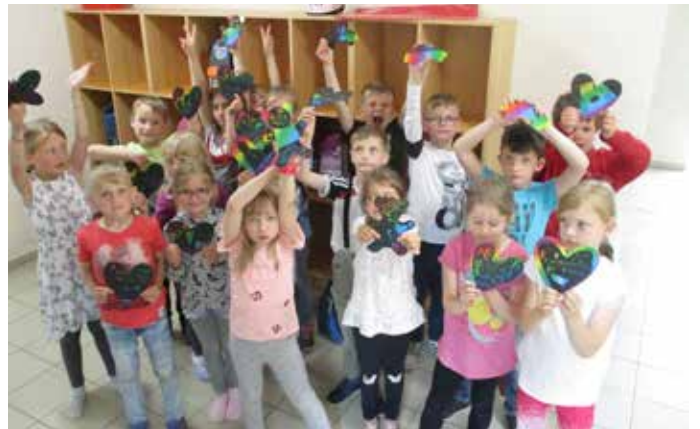
Für unseren Vati