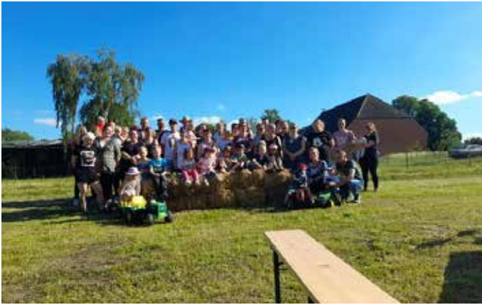
Am Abend haben sich die Kinder mit den Eltern noch einmal getroffen.