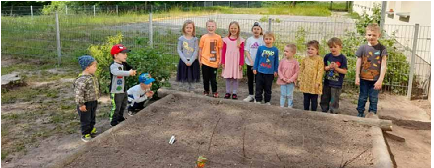
Jetzt können Möhren, Radieschen und vieles mehr in unserem neuen Beet wachsen. Danke an die Gemeindearbeiter.