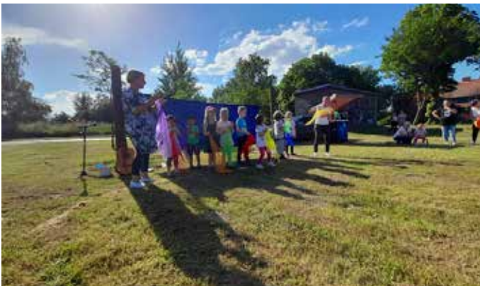
Mit einem kleinen Programm wurden die Eltern überrascht.