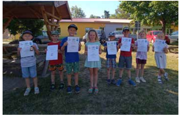
Sportlichste Klasse – Klasse 1