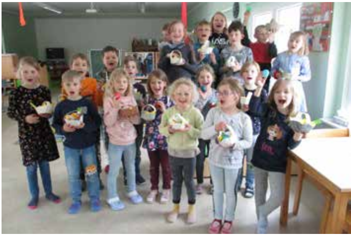
Der Osterhase war da