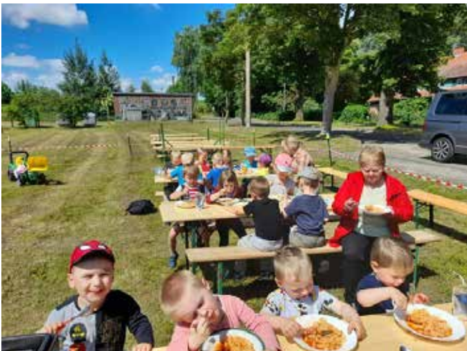
Mittagessen geliefert nach Lindhorst von der Küche Abel.