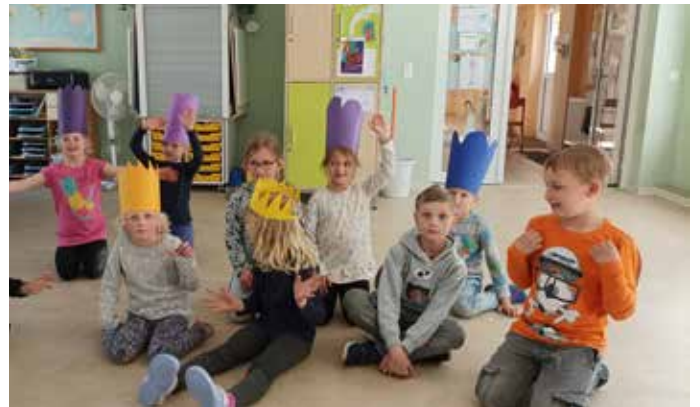
Probe für das Kitafest