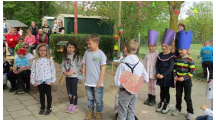
Kitafest 1. Klasse