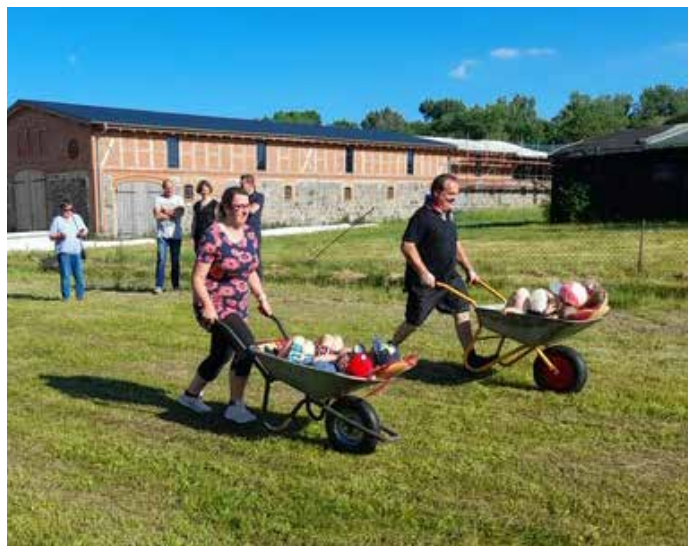
Verschiedene Stationen, wie z.B. Gummistiefel Weitwurf