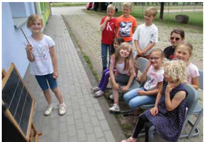
"Wir spielen Schule"