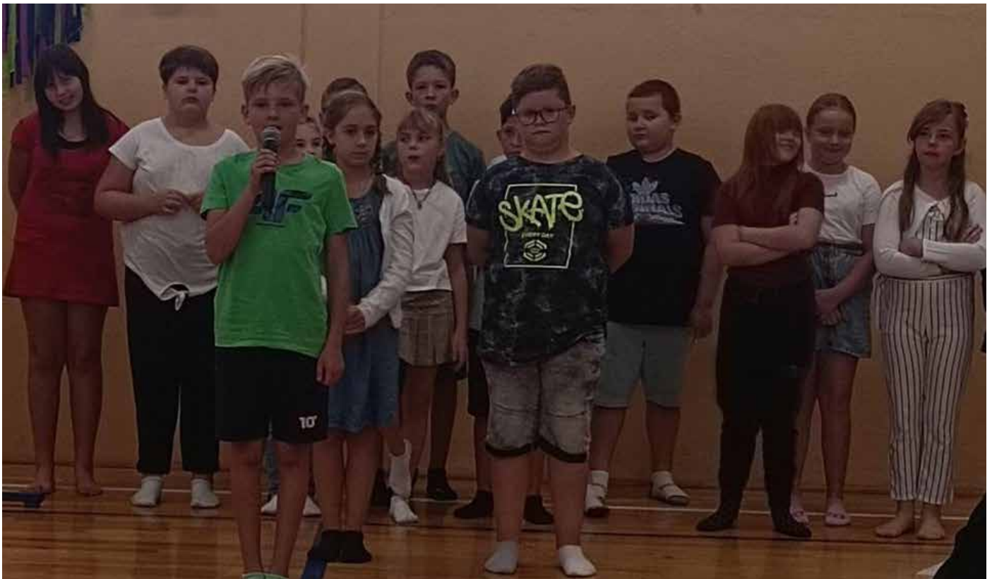
Programm der 4. Klasse