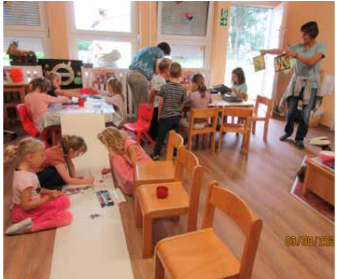
Murmelbilder und Malspaß