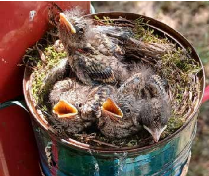
Nachwuchs auf dem Spielplatz