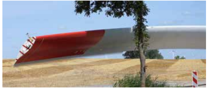
Flügeltransport - die Verzahnung an der Hinterkante

Aber jetzt kommt's: die Fläche, die diese Windblätter überstreichen ist mit fast 20.000 m 2 halb so gross wie die Oberfläche des Dorfsees zu Milow. Imposant – oder einfach nur nachdenklich machend?!