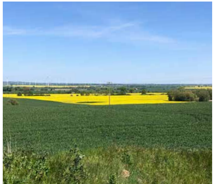
Ausblick von der Kaisermänover-Terrasse