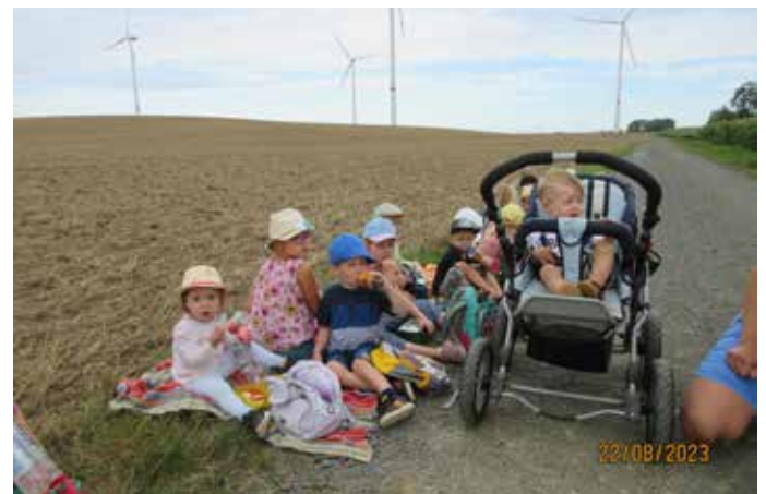
Wanderung in die Natur