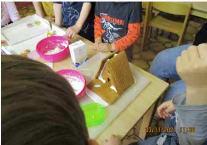
In der Weihnachtsbäckerei.