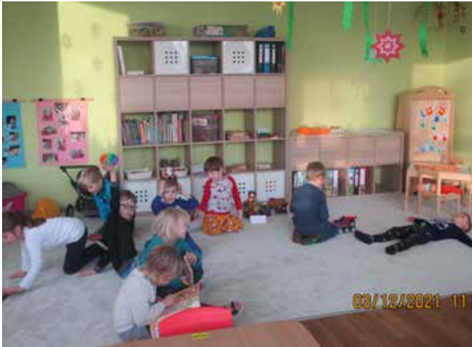
Hier macht es Spaß zu spielen.