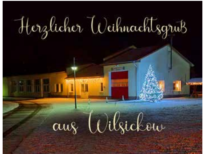
Die Kameraden der Feuerwehr Wilsickow & Chronikgruppe Wilsickow

Mit dieser warmen Lichterstimmung wünschen wir unseren Wilsickowern FROHE WEIHNACHTEN und einen GUTEN RUTSCH in ein gesundes NEUES JAHR. Ebenfalls senden wir auf diesem Wege auch sehr herzliche Weihnachtsgrüße an alle Einwohner der Gemeinde Uckerland.