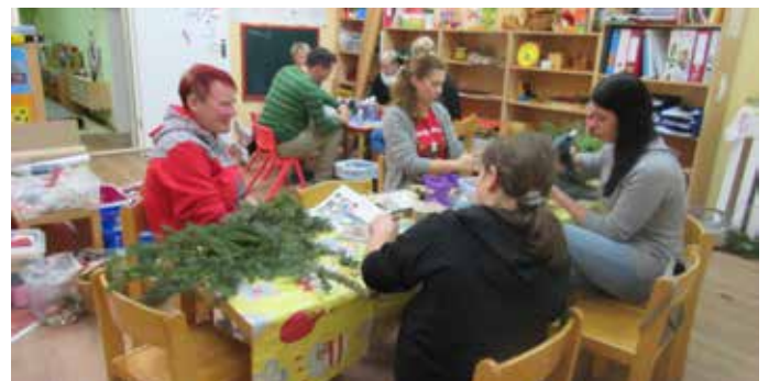
Basteln mit den Eltern