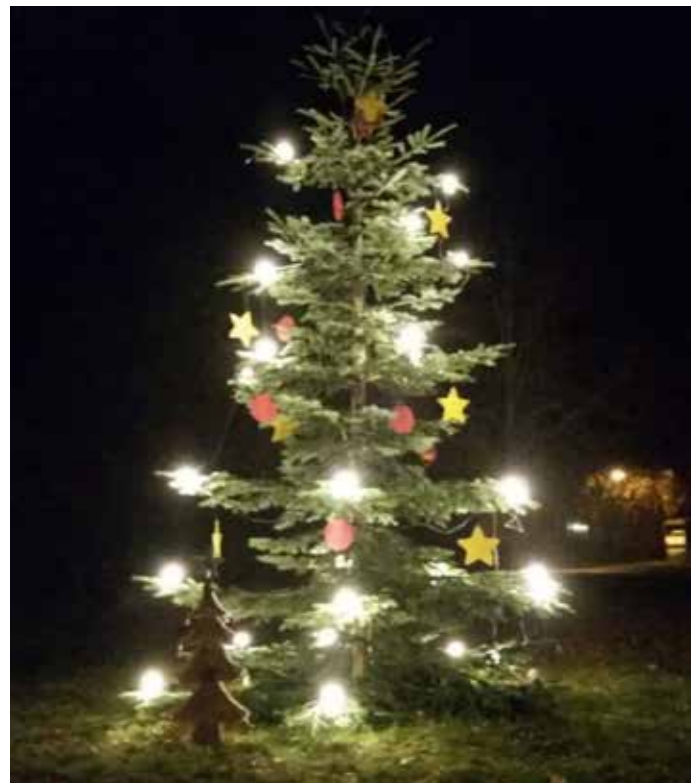
Weihnachtsbaum in Lübbenow

Wir wünschen allen Gewählten Gottes Segen für Ihre ehrenamtliche Tätigkeit in der Kirchengemeinde.