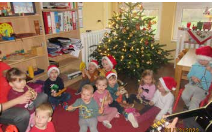
Wir machen Musik