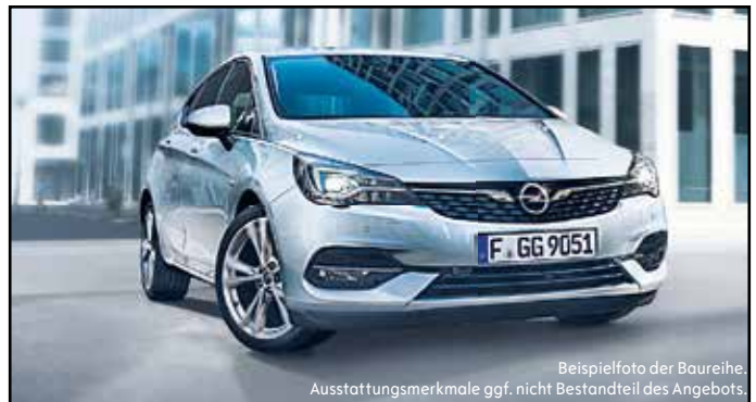
Beispielfoto der Baureihe, Ausstattungsmerkmale ggf. nicht Bestandteil des Angebots.

Lange Str. 3 (ehemalige Freizeitstation), barrierefrei, ruhige Lage, alleinstehende/r Rentner/in bevorzugt, 43,82 m 2 Kontakt nach 18 Uhr: 039753-222596, maik.fuerst67@web.de